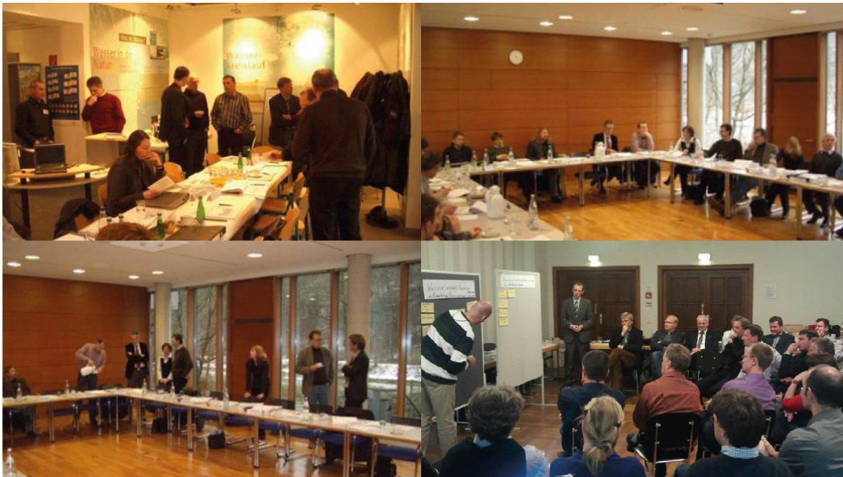
Abbildungen: Projektsitzungen des Kennzahlenvergleichs

Schwerpunkte vergangener Jahre waren hier z. B. Erfahrungen mit Energieoptimierung, Fachkräftemangel oder die Auswirkungen der gesetzlichen Änderungen im Bereich der Klärschlamm Entsorgung.